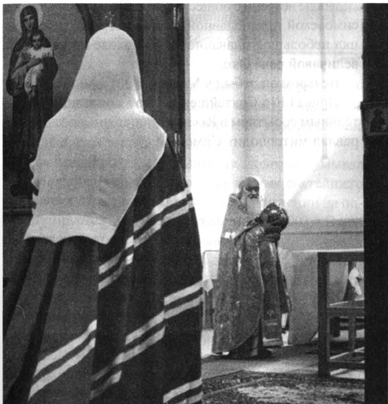
Святейший патриарх Алексей II и благочинный Касимовского округа протоиерей Владимир Правдолюбов перед освящением престола Вознесенского собора

В этом славном городе патриарх Алексей II освятил переданный Рязанской епархии древний Возне-