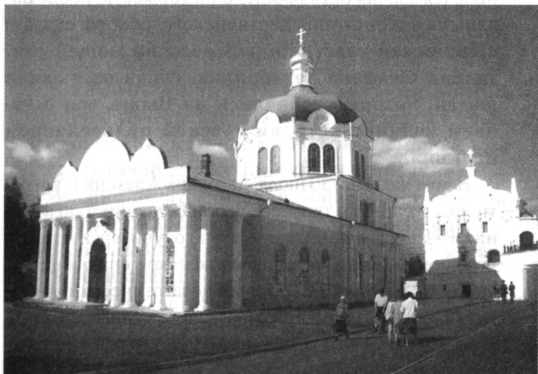
Христорождественский собор Рязанского кремля