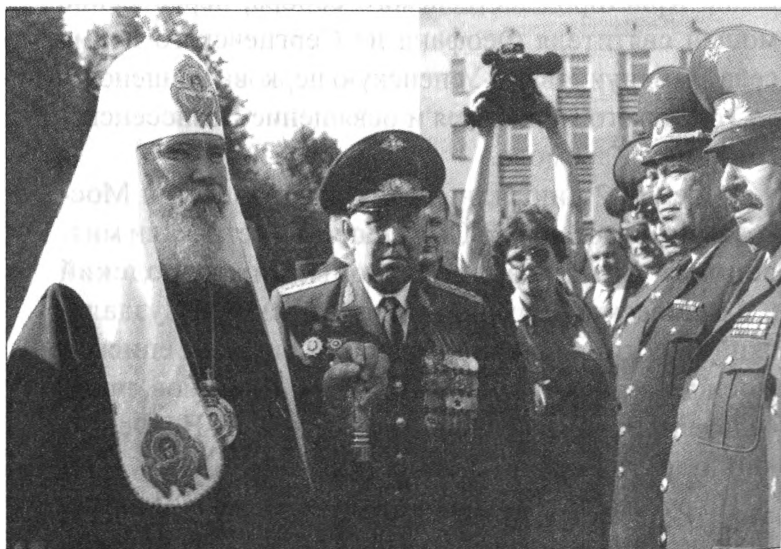
Встреча патриарха Алексея II в автомобильном институте

29 июня патриарх Алексей II посетил военный автомобильный институт, где его встречали Главнокомандующий ВДВ генерал Г. И. Шпак (впоследствии ставший рязанским губернатором), представитель ми-