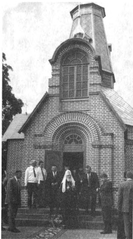
Посещение Татианинского храма

шой вклад в духовно-нравственное возрождение Рязанского края.