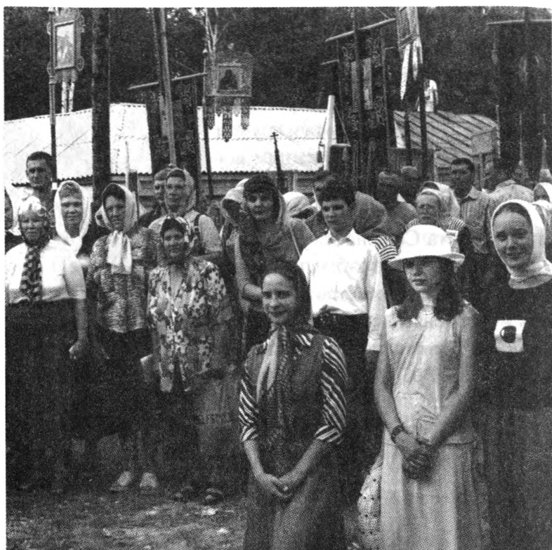
Рязанская делегация на крестном ходе

на торжества из разных уголков России и зарубежных стран. Крестный ход освящался множеством святынь – запрестольными крестами и иконами, привезенными из разных приходов Рязанской, Тамбовской, Владимирской и других епархий. Более восьмидесяти хоругвей торжественно возвышалось над крестным ходом, в котором участвовали около 3 тысяч человек.