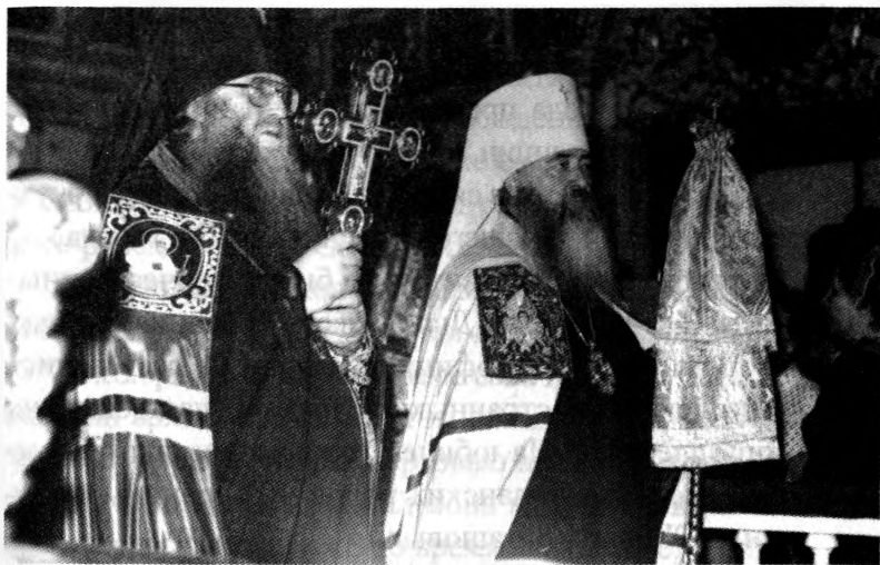
Митрополит Ювеналий и архиепископ Симон

Авеля совершил Божественную литургию в Успенском соборе Рязанского кремля. После литургии он зачитал праздничное Послание Святейшего патриарха Московского и всея Руси Алексия II. В нем говорилось: «Надеюсь, что настоящее празднество послужит возрождению веры в сердцах рязанского народа, который всегда славился своим благочестием, строя жизнь свою на основах православия».