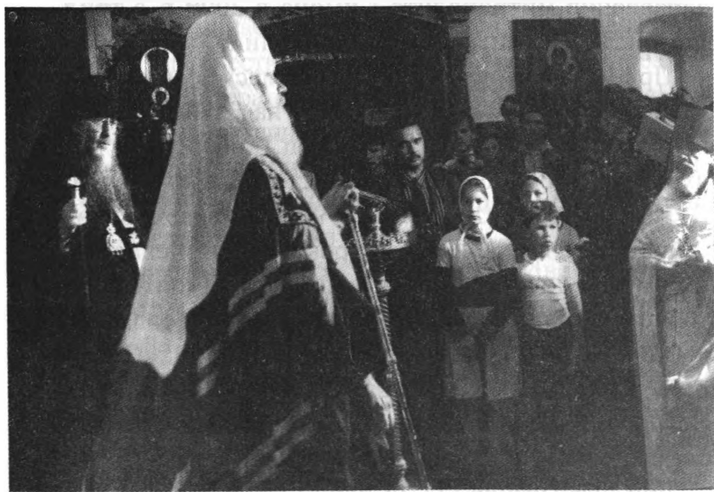
Речь Святейшего в храме Иоанна Богослова