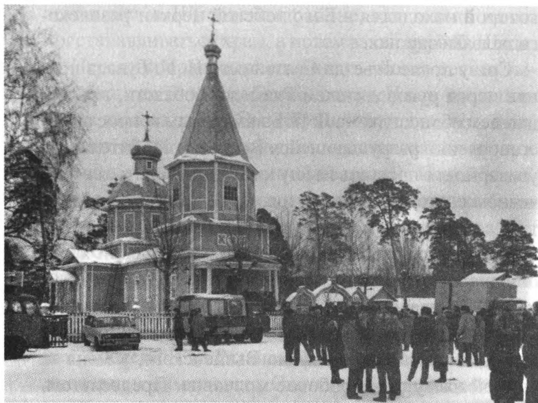
Село Эммануиловка. Сергиевский храм. 23 января 1994 г.

ворника Вышенского. 23 января, в день памяти святителя, они вместе с архиепископом Симоном и сотнями православных рязанцев молились в Сергиевском храме. Божественную литургию возглавлял митрополит Волоколамский и Юрьевский Питирим.