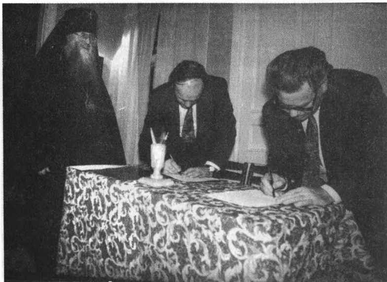
Соглашение подписывают глава администрации Рязанской области Г. К. Меркулов и мэр города В. К. Марков

Главным достижением конференции стало подписание Соглашения между администрацией Рязанской области, администрацией Рязани и Рязанской епархией «О дальнейшем взаимном сотрудничестве в деле духовно-нравственного воспитания молодого поколения» . Соглашение подписа-