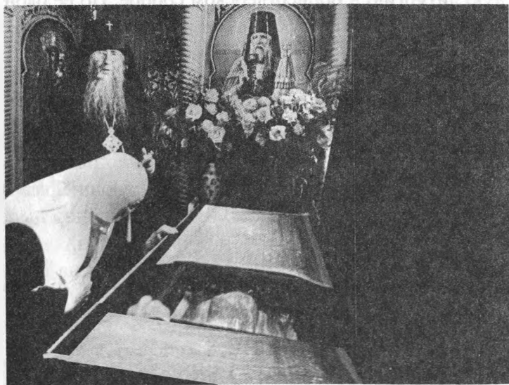
Поклонение мощам святителя Феофана

Отъезд Предстоятеля Русской православной церкви Алексия II из Рязанской епархии совпал с празднованием памяти всех Святых и Боголюбской иконы Божией Матери, один из чудотворных списков