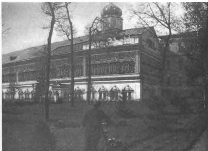
Семинарист на послушании по уходу за газоном

Так же он ценил и любил акафист преподобному Сергию, который читается в Лавре вечером каждое воскресенье и ежедневно в течение всего дня.