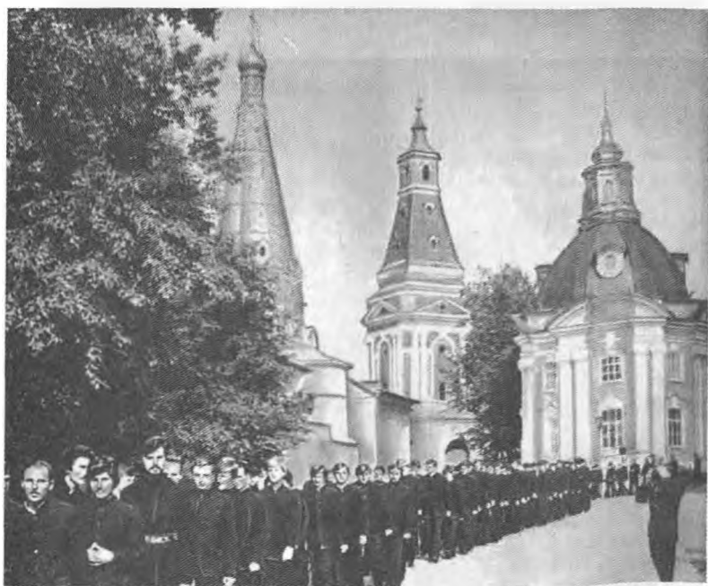
Учащиеся направляются на молебен перед началом учебного года. 1968 год