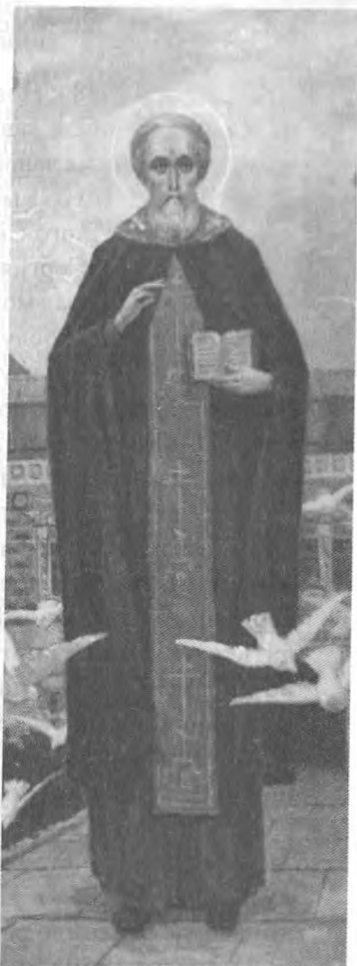
Преподобный Сергий Радонежский. Фрагмент росписи Покровского храма духовной академии и семинарии

Размышляя над иноческим подвигом Преподобного, над силой Божией благодати, которая действовала в нем, Сергей возгорелся душой и решил полностью посвятить себя Господу и принять монашество, следуя