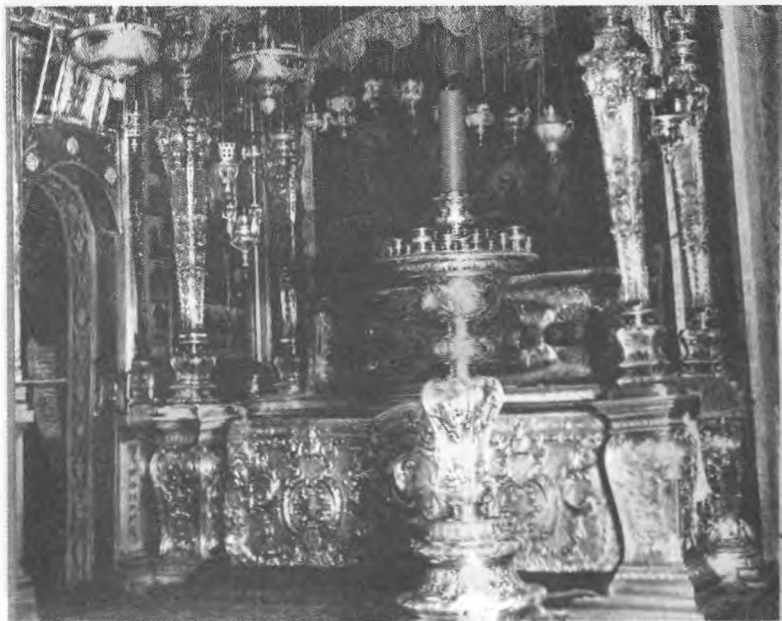
Рака с мощами преподобного Сергия Радонежского