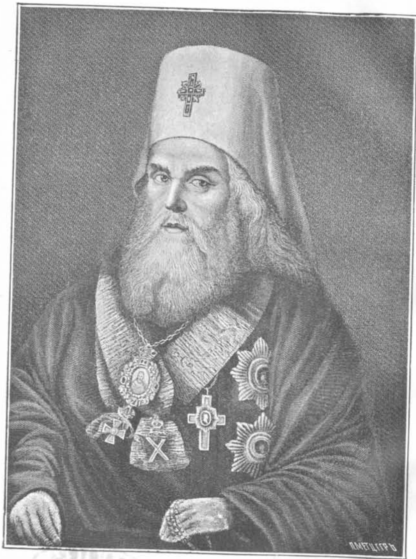
ПЛАТОНЪ Митрополитъ Московскій.